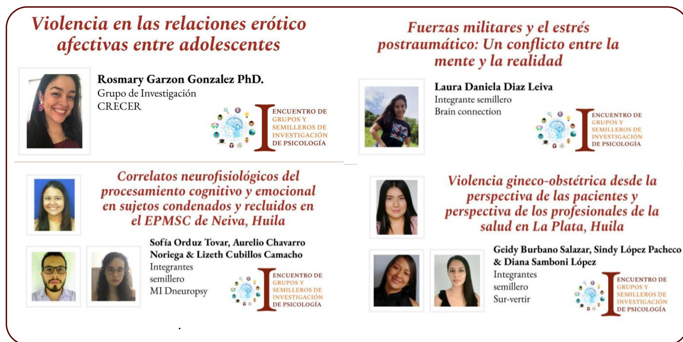
Figura 3. Ponencias destacadas en el #1investigacionpsicousco.

CRECER ya ha acumulado más de 1200 reproducciones. Así mismo, se destacan algunas ponencias de los estudiantes que se acercan a 1000 visualizaciones, “Correlatos Neurofisiológicos del procesamiento cognitivo y emocional” de los del semillero MI Dneuropsy de la sede Neiva, y por parte de la sede de la Plata, “Violencia gineco-obstétrica desde la perspectiva de las pacientes” del semillero Sur-Vertir y “Fuerzas militares y el estrés postraumático” del semillero Brain Connection (Ver Figura 3).