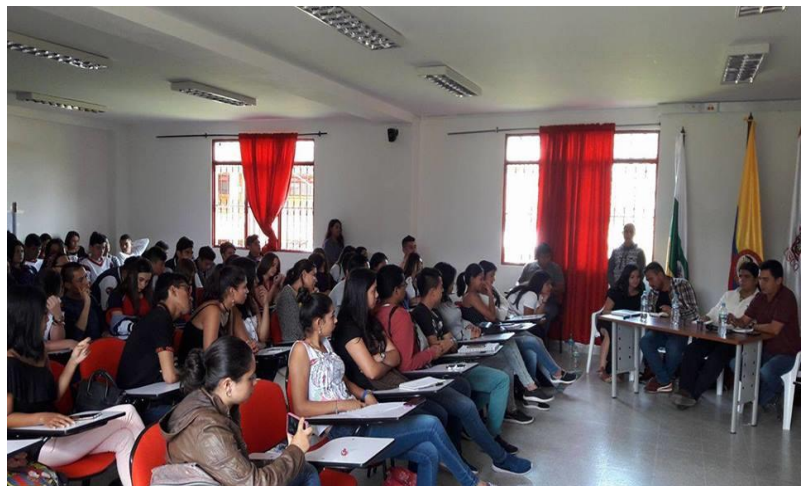
Semana de la comunicación en Pitalito, 2018.

El Programa de Comunicación Social y Periodismo de la Universidad Surcolombiana en el municipio de Pitalito es extensión de su homologado de la sede principal de la ciudad de Neiva, creado en 1994, con acreditación de calidad otorgada mediante resolución 7465 del 16 de octubre de 2009, renovada mediante resolución 1022 el 24